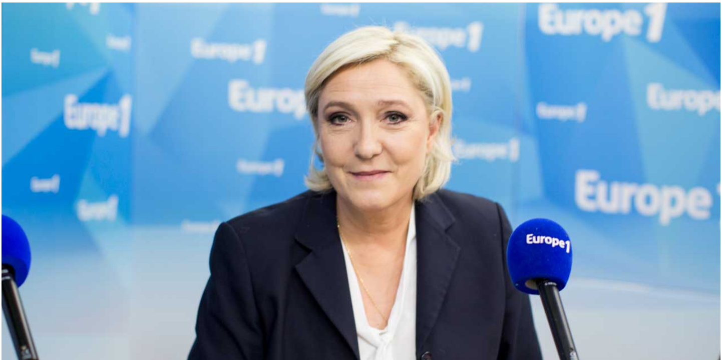
Marine Le Pen est l'invitée d'Europe 1 lundi matin.